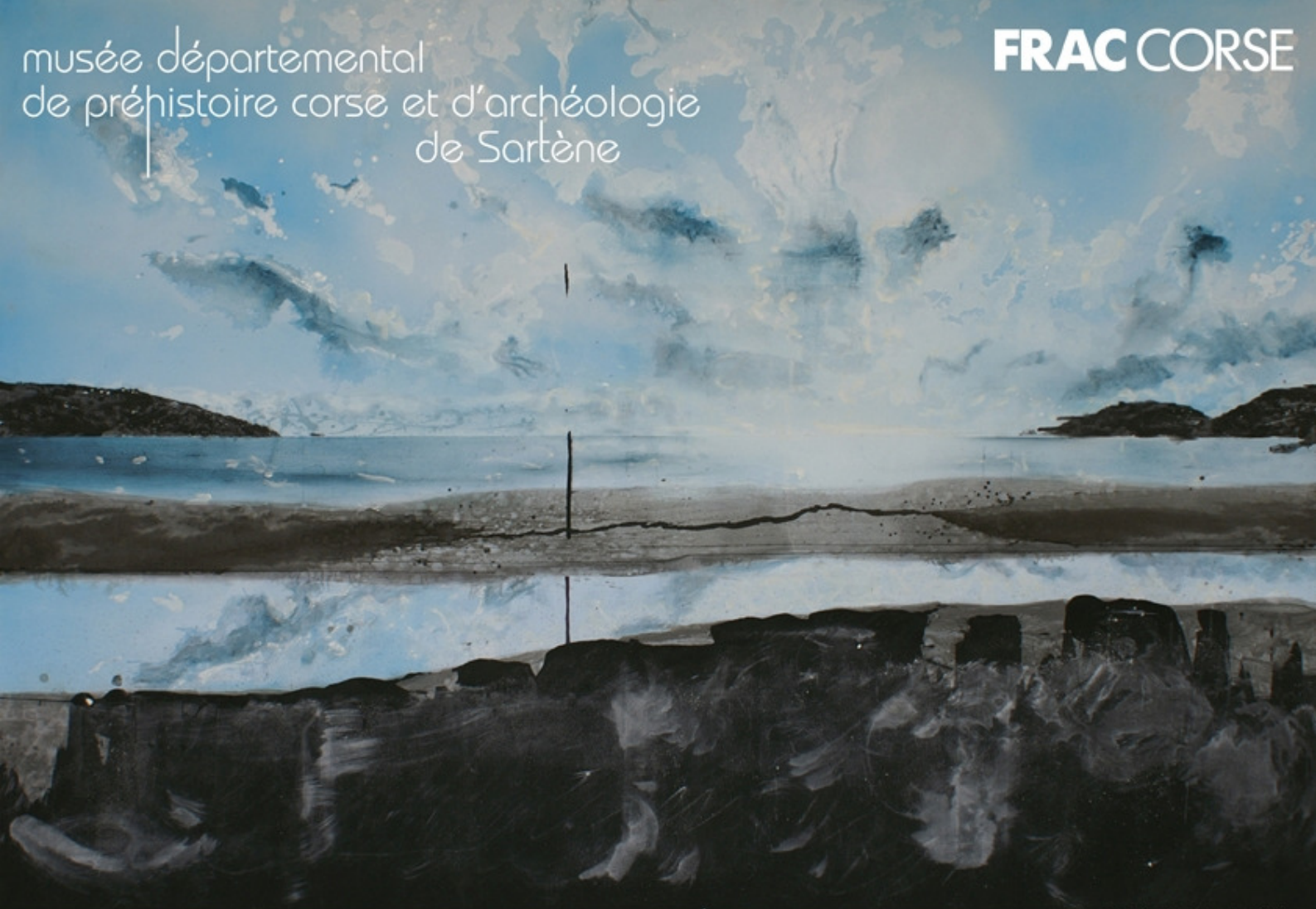
© David Raffini, Après la pluie , 2007